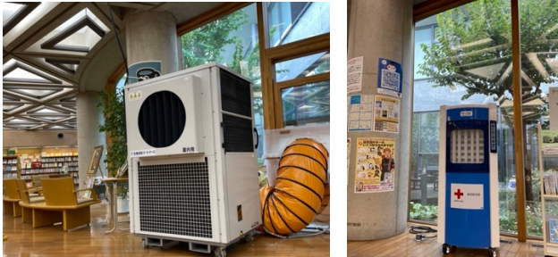
<今年、暑い夏の救世主・スポットクーラー達>

議題 1: 『たはら版・闘う館長室! ?』 .. エアコン工事 (今年度未完了予定) と秋が来た!